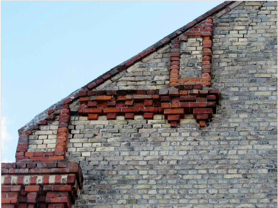
att. 12. Korpuss 3 (centrālais). Frontona fragments. Skats no Ventas puses