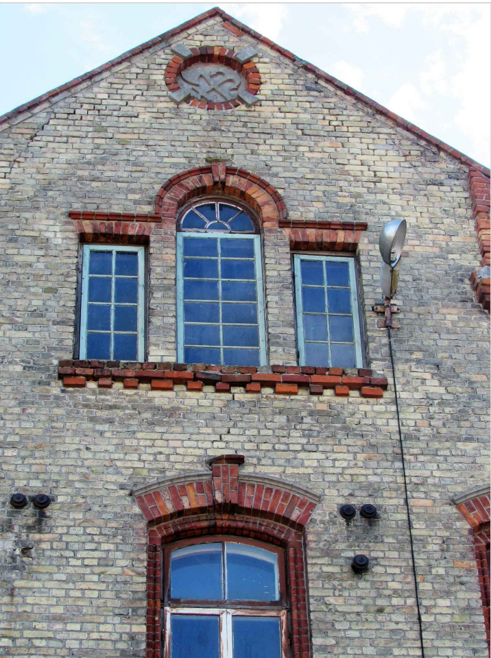
att. 15. Korpuss 3. Frontona fragments. Skats no Ventas puses