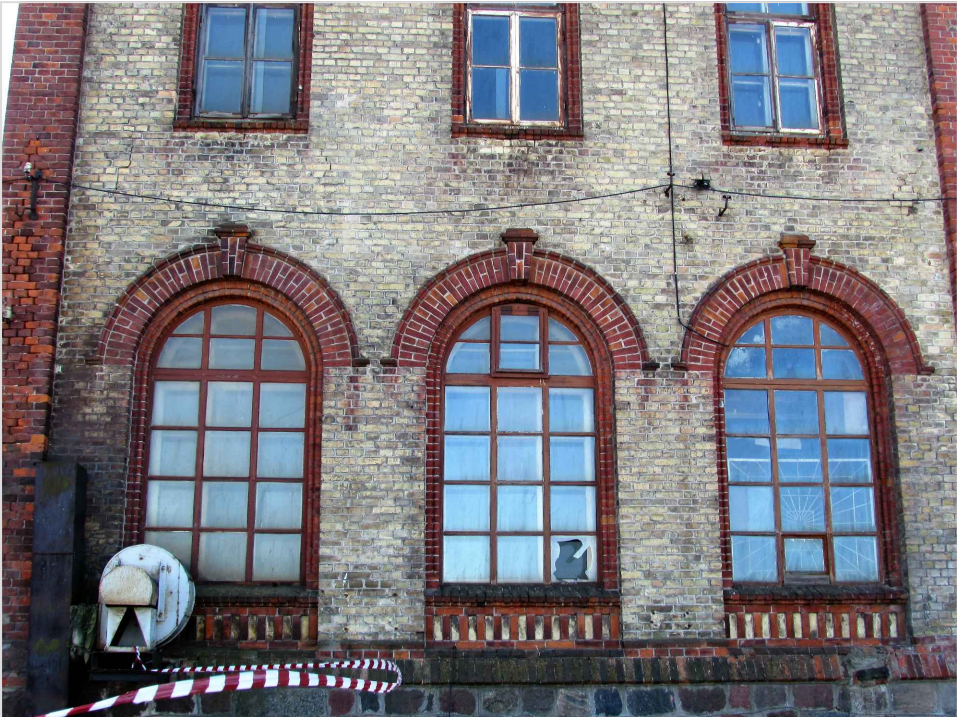
att. 13. Korpuss 3. 1. st. logu ailu dekoratīvā apdare. Skats no Ventas puses