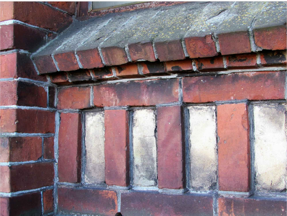
att. 16. Korpuss 4. Loga ailu dekoratīvā apdare